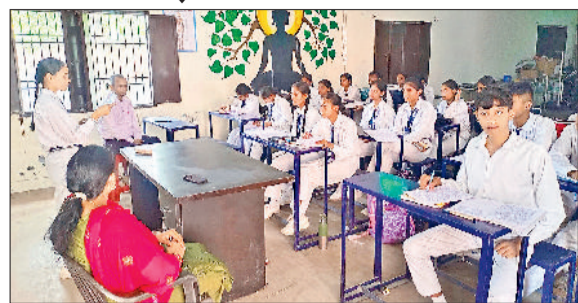
सोनीपत। सोनीपत के मॉडल टाउन स्थित राजकीय मॉडल संस्कृति विद्यालय में शिक्षा ग्रहण करते विद्यार्थी।

▶▶ प्रदेश में 2113 व सोनीपत में परीक्षा उत्तीर्ण करने वाले 89 विद्यार्थी होंगे प्रशिक्षण व परीक्षा में शामिल ▶▶ सोनीपत के उत्तीर्ण विद्यार्थी 22 से 25 अप्रैल तक होने वाले प्रशिक्षण व परीक्षा में लेंगे भाग