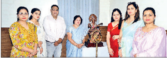
सोनीपत। कार्यक्रम के शुभारंभ अवसर पर कॉलेज स्टाफ एवं अन्य।

जीवीएम गर्ल्स कॉलेज में बिजनेस प्लान थीम पर आईआईसी इनोवेशन एरीना 2026 का आयोजन किया। जिसके अंतर्गत आयोजित विभिन्न शैक्षणिक प्रतियोगिताओं में छात्रों ने उत्साहपूर्वक भाग लेंते प्रतिभा का प्रदर्शन किया। कार्यक्रम में मुख्य रूप से पावरपॉइंट प्रेजेंटेशन और पोस्टर प्रेजेंटेशन प्रतियोगिताएं आयोजित की गईं, जिनमें छात्राओं ने नवाचार और रचनात्मकता के उत्कृष्ट उदाहरण