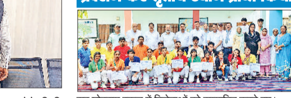
सर छोदराम स्कूल में विजेताओं को सम्मानित करते हुए।