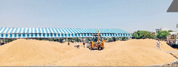
सोनीपत। अनाज मंडी में लगी गेहूं की ढेरियां।

कटाई के बाहर मंडियों में दस्तक दे चुका है, लेकिन उठान की लचर व्यवस्था के चलते करीब 10 लाख किन्टल से ज्यादा गेहूं मंडियों व खरीद केंद्रों पर पड़ा है। सरकारी आंकड़ों की बात करें तो करीब 14020 किसानों से कुल 251813 मीट्रिक टन गेहूं की खरीद की जा चुकी है, लेकिन अब तक महज 27304 मीट्रिक टन गेहूं का ही उठान हो पाया है। उधर खरीद एजेंसियों की ओर से अब तक करीब 25 प्रतिशत किसानों को ही भुगतान किया गया है। ऐसे में किसान का कहना है कि अनाज उठान प्रक्रिया में सुधार नहीं किया गया, तो उनके समझ बड़ी परेशानी खड़ी हो सकती है। इसके